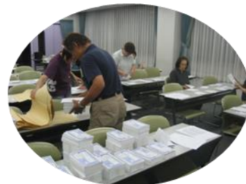
カンパ用紙発送作業中

2回目の期日が9月30日に決まりました。1回目同様、裁判が終わった後、高松センタービルにて、報告集会を開きます。そこで、裁判の様子を報告しますので、仕事のため裁判が傍聴できない方もぜひ、参加お願い致します。なお、詳しい案内は傍聴案内にありますので、目を通してください。