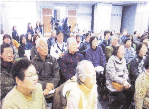
応援に駆けつけてくれた支援団体の皆様

今回、高松または東京の会場に来てくださった方、ありがとうございます。おかげさまで、無事に提訴報告会を終えることができました。しかし、これからが本番です。いつでもどこでも手話通訳がつくことを目指すだけでなく、裁判するにあたっての、原告への情報保障、そして傍聴者のための情報保障も求めています。障害に関係なく、安心して暮らせる社会の実現を目指して、共に頑張っていきましょう!