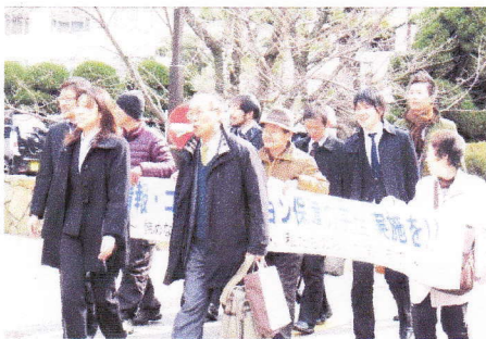
高松地方裁判所までの行進の様子

2月28日(火)に高松と東京の会場にて、提訴&報告集会を実施しました。東京では、社会文化会館で約80名の参加者で提訴決意集会が行われました。