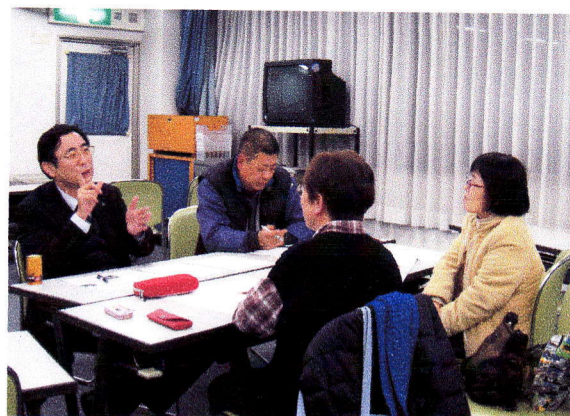
事務局会議：カンパチーム会議の様子